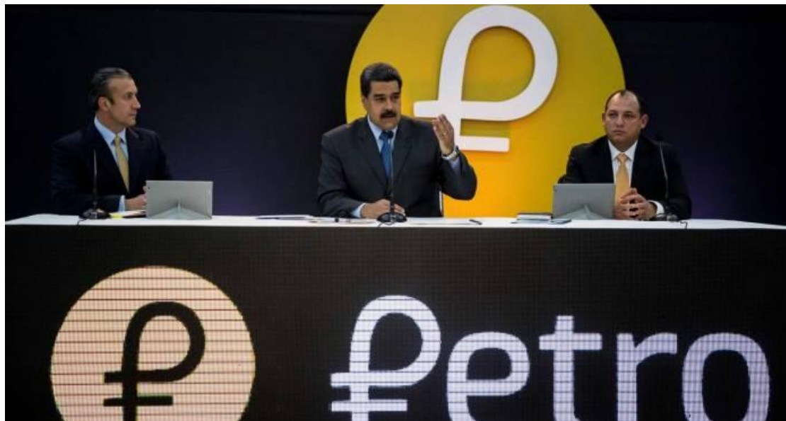
نیکلاس مادورو، رئیس جمهور ونزوئلا در حال ارائه گزارش وضعیت ارز دیجیتال پترو

اولیه خود در بیش از ۱۸۶,۰۰۰ فقره گواهی خرید، بیش از ۵ میلیارد دلار سرمایه جذب کرده است. فروش پترو با وجود تحریمهای شدید بین‌المللی باعث رونق در ذخایر پولی این کشور شده است. پترو ارز دیجیتال مبتنی بر نفت که با هدف مقابله با تحریمهای اقتصادی ایالات متحده بر این کشور آمریکای جنوبی طراحی شده و بنابر اعلام وزارت امور خارجه ونزوئلا استفاده از پترو برای معاملات بین‌المللی در دستور کار کمیسیون تجاری ونزوئلا- روسیه (که چند روز قبل برگزار شد)، قرار گرفته است. [۱۲] گرچه بعد از آن، دونالد ترامپ با صدور فرمانی هرگونه معامله ارز دیجیتال «پترو» ونزوئلا را برای آمریکا و هم پیمانانش ممنوع اعلام کرد و آن را به فهرست تحریم های ونزوئلا افزود. [۱۳]